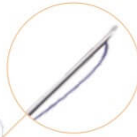
Fine Needle MONO